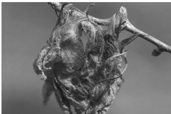
越冬巣、シロチョウ科では特異的

昆虫などの生物に関心を持つことが環境問題を考えたりする第一歩であり、このような実践がそのきっかけになればうれしい。またエゾシロチョウという昆虫を通して、生態系のしくみを理解し、この視点から、環境問題などに興味・関心を持ち、考えることのできる生徒を育てたいというのが今回の実践のねらいである。