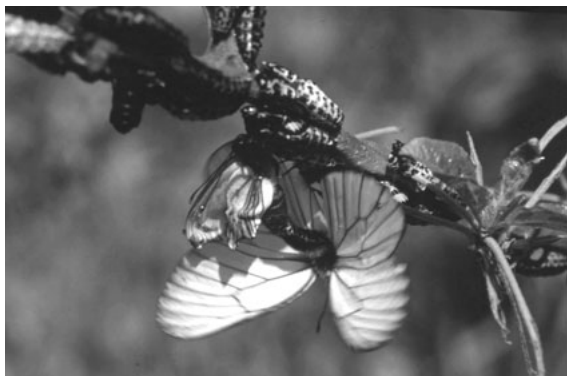
羽化直後、交尾中のひとつがい、下になっているのが雄