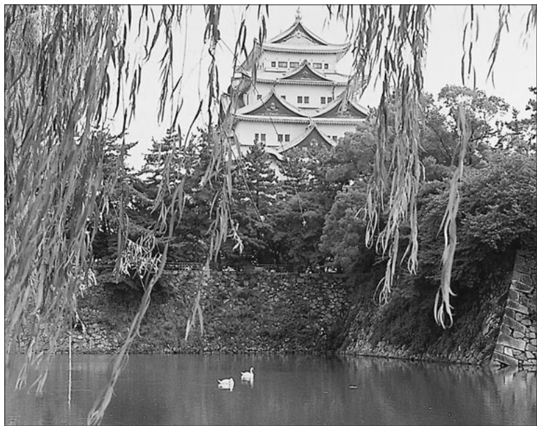
日本一大きい面積を持つ名古屋城の絶景