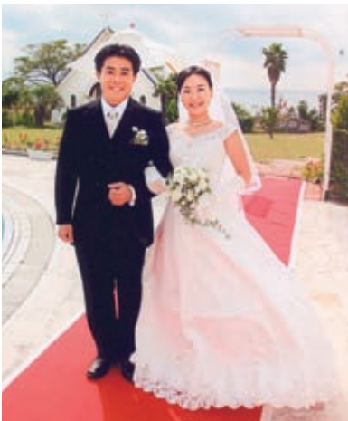
ミュージカル・ハッピーウエディング！ たっ君のお相手は後輩の元女優さん