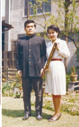
主人の卒業式の日 (昭和44年、東京北区 滝野川にて)