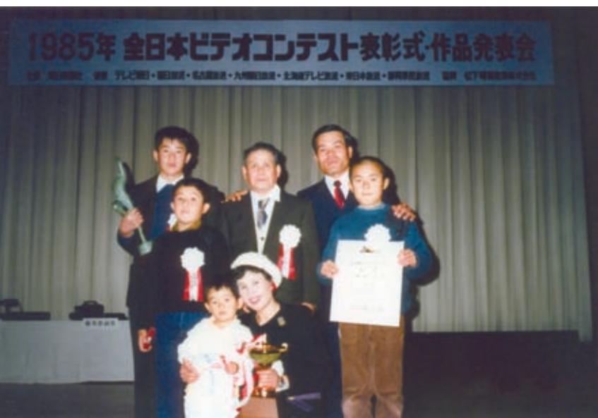
家族揃って全日本ビデオコンテスト表彰式。 “女性初の大賞受賞”（昭和60年、東京有楽町）