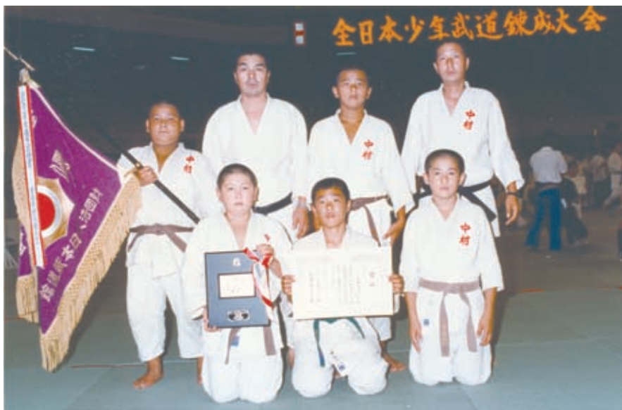
全日本少年武道錬成大会(柔道の部)団体優勝。前列右が長男(昭和58年、日本武道館)