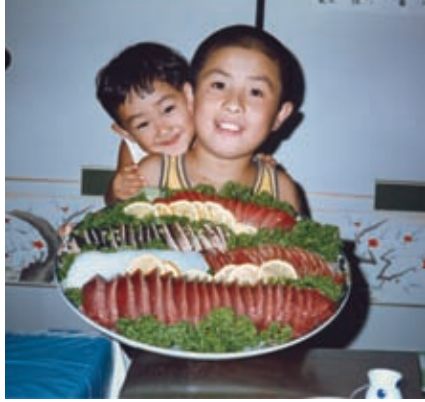
たっ君初めてのお造り皿鉢 (昭和60年)