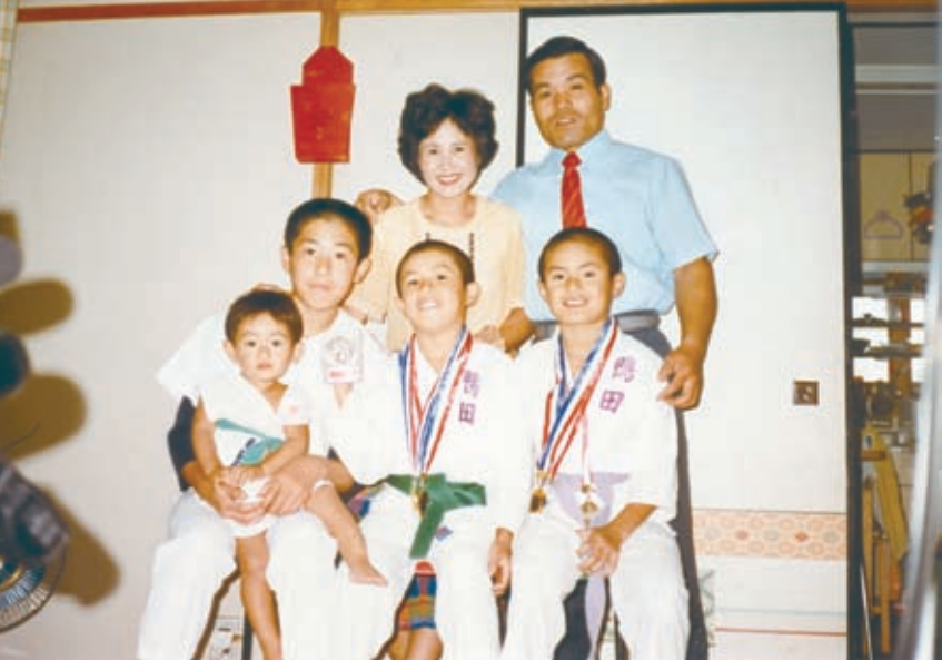
4男登場。これでフルメンバー（昭和59年、高知県警朝倉官舎）