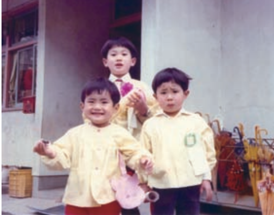
3兄弟の小学校、保育園時代 (昭和52年、名野川)