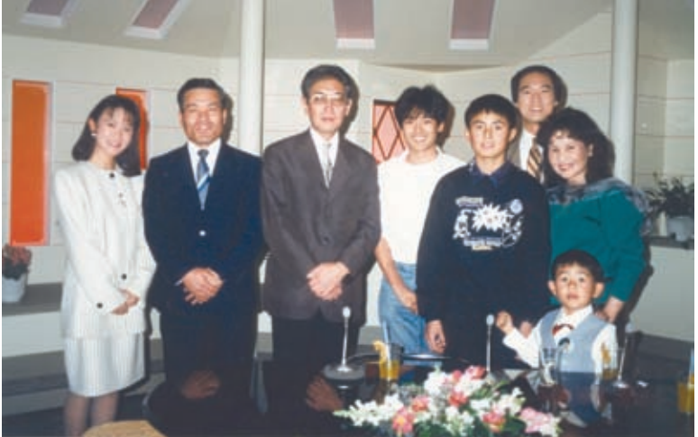
勤労感謝の日NHK特別番組に出演 大島渚先生ありがとうございました。 (昭和63年)